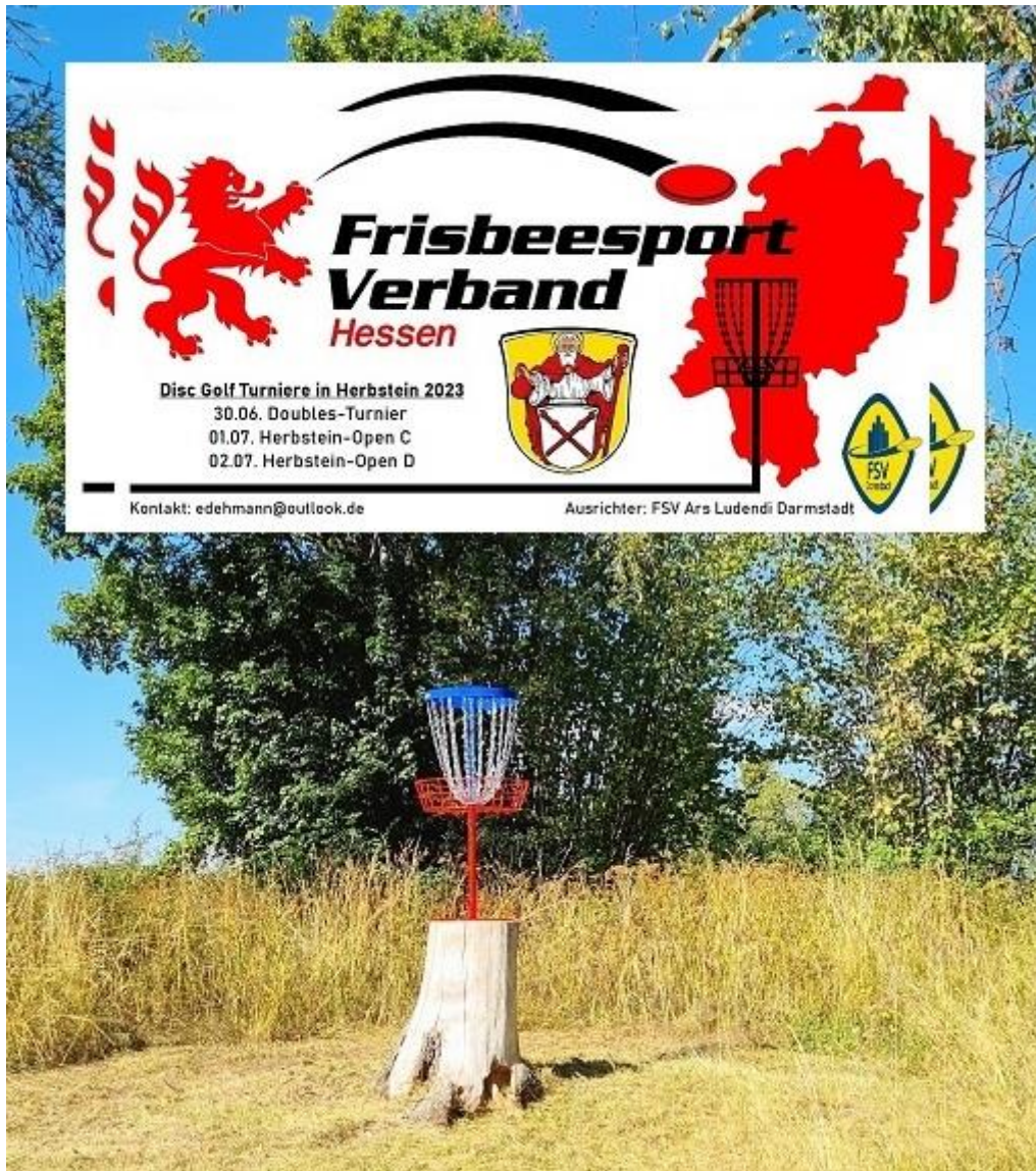
Korbposition Bahn 2