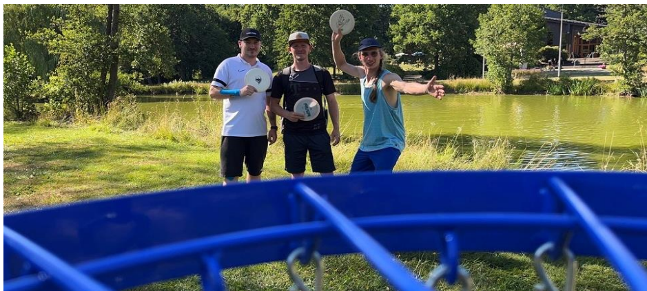
Korbposition Bahn 7 am Teich