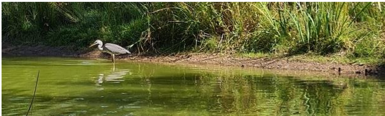
Stammgast am Teich der Bahn 7

02.07.2023 Herstein-Open D Anmeldung zum Turnier 8.00-9.00 Uhr Frühstücksbuffet 7.30-9.00 Uhr Playersmeeting 9.00 Uhr Beginn der 1. Runde 9.30 Uhr Beginn der 2. Runde 13.45 Uhr Siegerehrung 17 Uhr